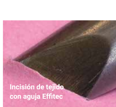
Incisión de tejido con aguja Effitec