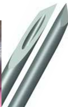
Desgarro de tejido con aguja estándar